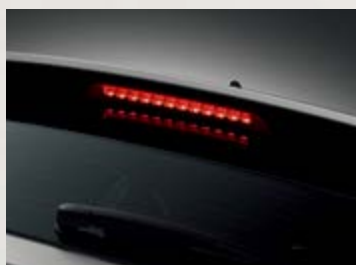
Đèn phanh trên cao