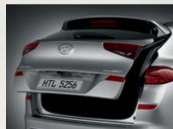
Cốp điện thông minh