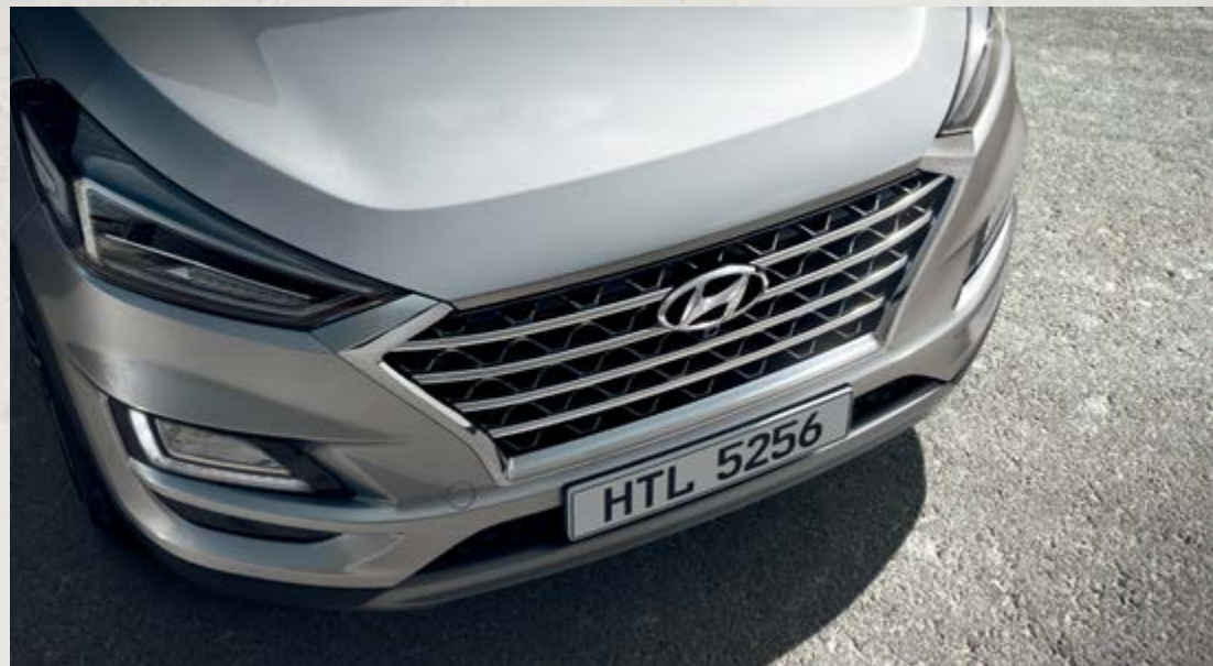
Lưới tản nhiệt dạng thác nước Cascading Grill ấn tượng