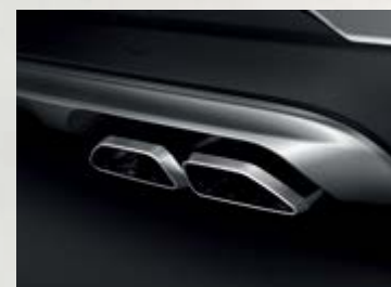
Ống xả kép