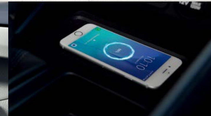
Sạc điện thoại không dây chuẩn Qi