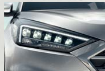
Cụm đèn pha Full LED mạnh mẽ