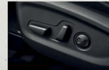
Ghế lái chỉnh điện 10 hướng