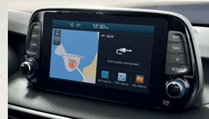
Màn hình cảm ứng 8 inch

Không gian nội thất rộng rãi và công nghệ tiện nghi bên trong chiếc xe Hyundai Tucson có thể đáp ứng mọi nhu cầu và sở thích của bạn