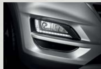
Dải đèn LED ban ngày sắc sảo