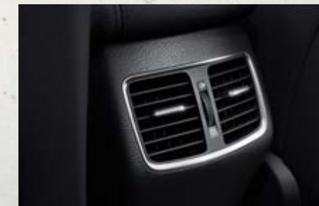
Cửa gió điều hòa hàng ghế sau