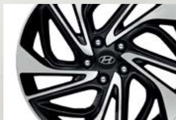
Lazang hợp kim 19 inch thể thao