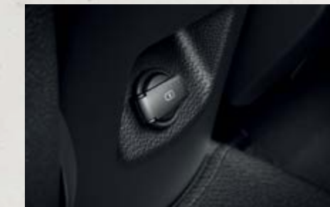
Cổng usb hàng ghế sau