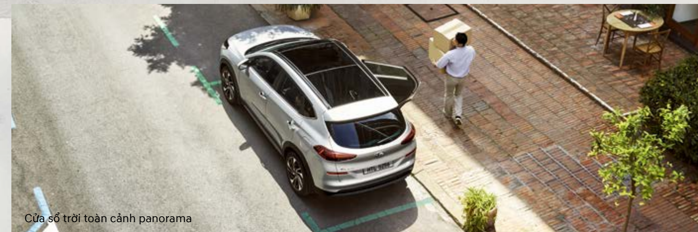
Cửa sổ trời toàn cảnh panorama